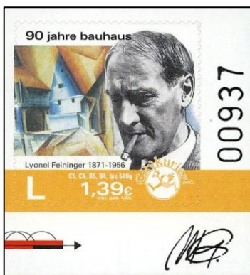
Lyonel Feininger

Lyonel Feininger wurde 1871 in New York geboren. Er kam 1887 erstmals nach Deutschland, wo er mit Zeichen- und Kunstunterricht begann. Besonders seine Karikaturen fanden großen Anklang, so dass er ab 1893 freischaffend arbeiten konnte.