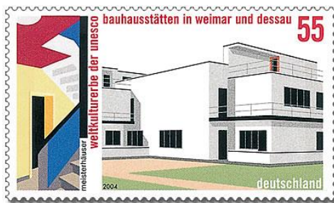
Bauhaus-Meisterhäuser in Dessau