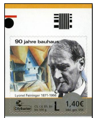
Lyonel Feininger (Privatpost Citykurier), Überdruck wegen Portoerhöhung