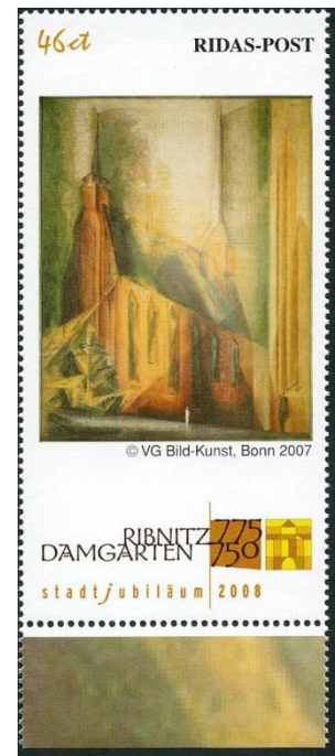
Klarissenkirche (1927) (Privatpost Ridas-Post)

Feininger hat im Laufe seiner Ostsee-Aufenthalte natürlich neben der Architektur besonders auch das Strandleben, die (Segel-) Schiffe und die Wolken künstlerisch gewürdigt. Davon zeugten in der Ahrenshooper Ausstellung zahlreiche Exponate, die häufig die beschriebene Arbeitsweise Feiningers erkennen ließen. Selbst viele Jahre nach Rückkehr in die USA entstanden noch Werke, die auf seinen „Natur-Notizen“ der geliebten Ostsee basierten.