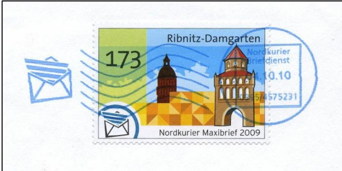
Rostocker Tor (rechts im Bild)

Leider kann ich Ihnen hier keine Abbildung eines dieser Werke präsentieren. Es gibt von den offiziellen Postverwaltungen überhaupt nur 2 Werke Feingers auf Briefmarken, eines davon die oben erwähnte „Marktkirche von Halle“. Und das Foto eines seiner Werke hier abzubilden, würde den finanziellen Rahmen unseres Rundbriefes sprengen. Denn Lyonel Feininger ist noch keine 70 Jahre verstorben, so dass neben Gebühren für das Copyright des Fotos auch Zahlungen an die VG Bild-Kunst fällig würden. Vielleicht ist das Motivation, bei künftigen Ausstellungsbesuchen auf „The Gate“ besonders zu achten?