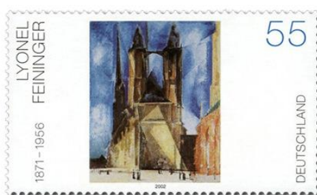
Marktkirche von Halle (1930)

Vom 19.3. bis 17.7.2016 zeigte das erst 2013 eröffnete Kunstmuseum Ahrenshoop eine sehenswerte Ausstellung zu Lyonel Feininger. „Rügen, Ribnitz, Usedom – Reisen an die Ostsee von 1892 bis 1913“ lockte der Untertitel. Und dem Autor dieses Berichts war es ein besonderes Vergnügen, an einer Kuratorenführung teilnehmen zu dürfen.